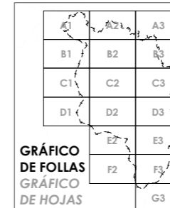
GRÁFICO DE FOLLAS GRÁFICO DE HOJAS 1 de 1