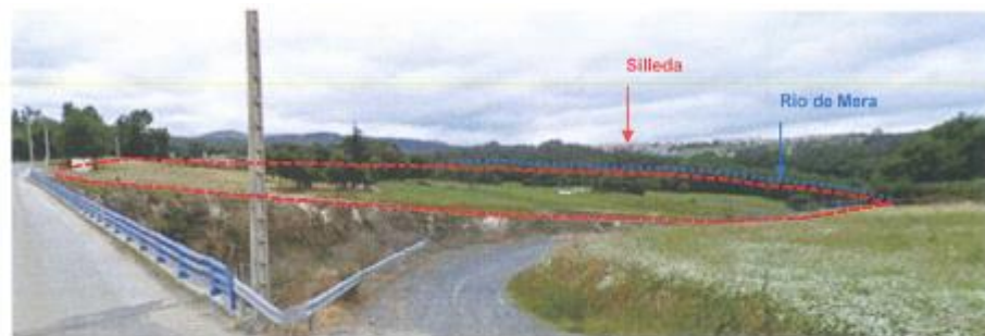
Vista da ocupación do SUD-11 desde o extremo noroeste do ámbito, ao fondo Silleda.

Recórtase o solo industrial nas proximidades do río. Elimínase o sistema xeral de zona verde do río, respetando o espazo natura delimitado na zona de habitat prioritario.