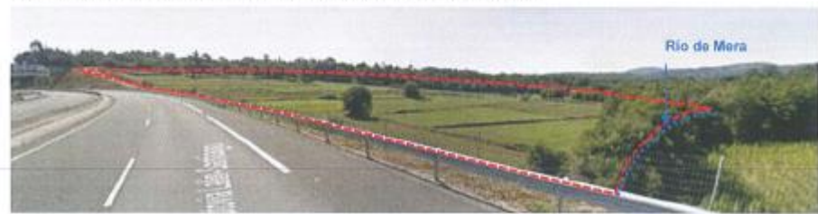
Vista da ocupación do SUD-11 desde o extremo noroeste do ámbito desde a AP-53.

Nas fichas da Normativa especificase que no SUD-11 e no SUD-12 se incorporará un estudo de impacto e integración paisaxística, con análise detallada da visibilidade. No SUD-11 indicase que as cesións establecidas legalmente (os espazos libres) se localizarán preferentemente nos terreas colindantes co río. Estas medidas considéranse axeitadas, no entanto, debido ao forte impacto paisaxístico que pode supoñer o desenvolvemento do SUD-11, deberase reformular a súa delimitación, axustando a súa superficie á estrita necesaria cos mínimos efectos negativos na paisaxe.