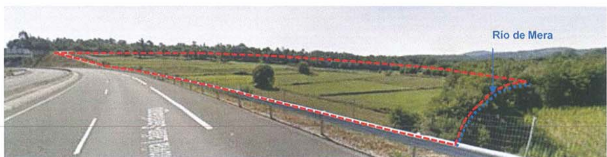
Vista da ocupación do SUD-I1 desde o extremo noroeste do ámbito desde a AP-53

Nas fichas da Normativa especificase que no SUD-I1 e no SUD-I2 se incorporará un estudo de impacto e integración paisaxística, con análise detallada da visibilidade. No SUD-I1 indicase que as cesións establecidas legalmente (os espazos libres) se localizarán preferentemente nos terreos colindantes co río. Estas medidas considéranse axeitadas, no entanto, debido ao forte impacto paisaxístico que pode supoñer o desenvolvemento do SUD-I1, deberase reformular a súa delimitación, axustando a súa superficie á estrita necesaria cos mínimos efectos negativos na paisaxe.