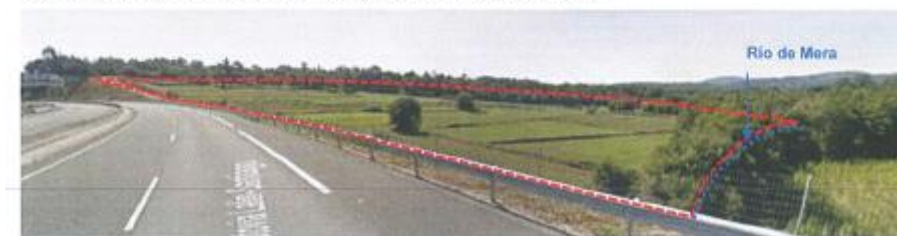
Vista da ocupación do SUD-11 desde o extremo noés do ámbito desde a AP-53.

Nas fichas da Normativa especificase que no SUD-11 e no SUD-12 se incorporará un estudo de impacto e integración paisaxística, con análise detallada da visibilidade. No SUD-11 indicase que as cesións establecidas legalmente (os espazos libres) se localizarán preferentemente nos terreas colindantes co río. Estas medidas considéranse axeitadas, no entanto, debido ao forte impacto paisaxístico que pode supoñer o desenvolvemento do SUD-11, deberase reformular a súa delimitación, axustando a súa superficie á estrita necesaria cos mínimos efectos negativos na paisaxe.