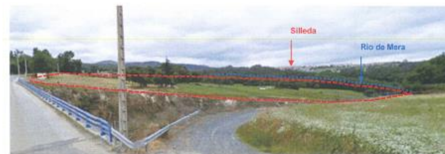
Vista da ocupación do SUD-11 desde o extremo noés do ámbito, ao fondo Silleda.

Recórtase o solo industrial nas proximidades do río. Elimínase o sistema xeral de zona verde do río, respetando o espaciao natural delimitado na zona de habitat prioritario.