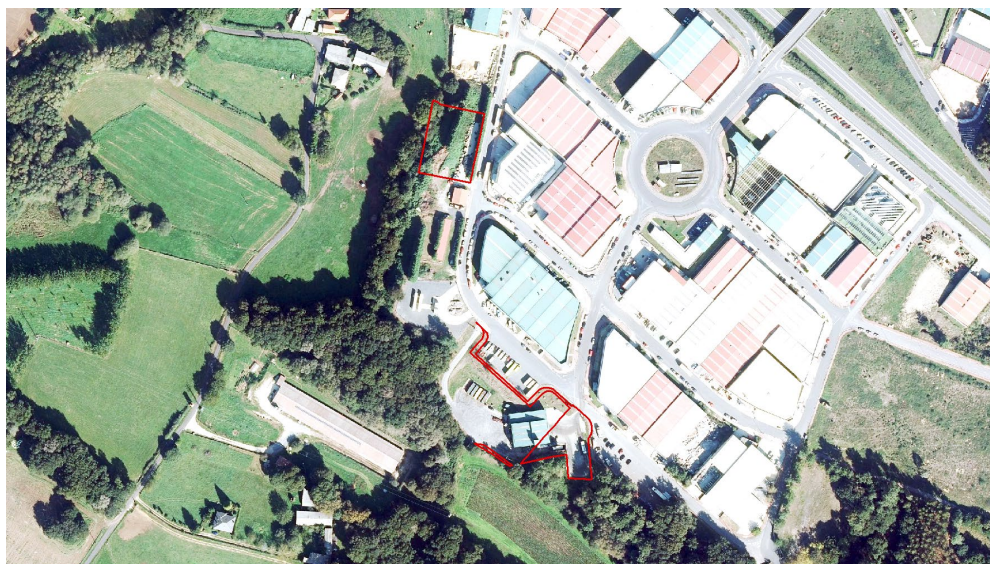
Ámbito da modificación puntual

O ámbito afectado pola presente modificación puntual nas inmediacións do polígono industrial Área 33, a carón da planta de transferencia de SOGAMA abarca unha superficie de 3.972 m 2 .