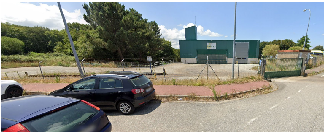
Parcela da planta de transferencia e espazo libre -zona verde 30-DE-P1 (esquerda da imaxe)

Estas modificacións supoñen tamén a revisión das aliñacións no fronte da parcela 1 da mazá 12 e tamén o perímetro en contacto coa zona posterior da parcela, axustando o ámbito ao actual peche da parcela en uso.