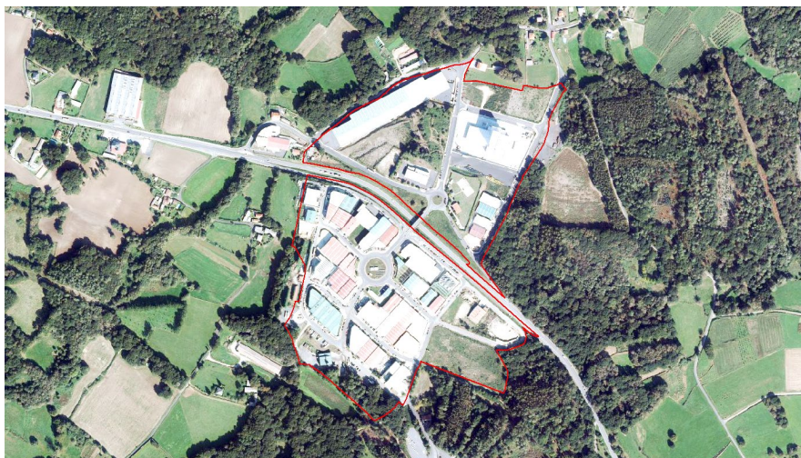
Polígono Industrial Área 33

A primeira fase do polígono desenvolveuse con 101.230 m 2 repartidos en 41 parcelas sendo cerca de 69.000 m 2 de uso industrial e 9.000 m 2 de uso comercial. Tras esgotarse esta fase Xestur promoveu unha ampliación de 59.441 m 2 con 35.495 m 2 de uso industrial.